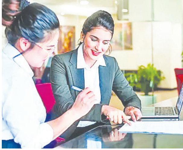
ಈ ವೈಕಿ ಶೇಕಡಾ 60 ರಷ್ಟು ಮಹಿಳೆಯರು ಉದ್ಯೋಗವನ್ನು ಸುರಕ್ಷಿತವಾಗಿರಿಸಲು ಮತ್ತು ಉಳಿಸಿಕೊಳ್ಳಲು ಮುಂದಾಗಿದ್ದಾರೆ ಎಂದು ಸಚಿವಾಲಯ ತನ್ನ ಮಾಹಿತಿಯಲ್ಲಿ ಈ ವಿಷಯ ತಿಳಿಸಿದೆ.

ನವದೆಹಲಿ, ಜೂ.1- ಕೌಶಲ್ಯ ಅಧಾರಿತ ಯೋಜನೆಯಡಿ ಉದ್ಯೋಗಾಕಾಂಕ್ಷಿಗಳಲ್ಲಿ ಶೇ. 70 ರಷ್ಟು ಮಹಿಳೆಯರೇ ಇರುವ ಸಂಗತಿಯನ್ನು ಕೇಂದ್ರ ವಾಣಿಜ್ಯ ಮತ್ತು ಕೈಗಾರಿಕಾ ಸಚಿವಾಲಯ ಮಾಹಿತಿ ಹೊರಹಾಕಿದೆ. ಕಳೆದ 15 ತಿಂಗಳ ಅವಧಿಯಲ್ಲಿ ಇದೇ ಮೊದಲ ಬಾರಿಗೆ ಉದ್ಯೋಗಾಕಾಂಕ್ಷಿಗಳಲ್ಲಿ, ಅದರಲ್ಲಿ ಕೌಶಲ್ಯ ಅಧಾರಿತ ಯೋಜನೆಯಲ್ಲಿ ಮಹಿಳೆಯರೇ ಹೆಚ್ಚಿನ ಸಂಖ್ಯೆಯಲ್ಲಿದ್ದಾರೆ ಎಂದು ಸಚಿವಾಲಯದ ಮೂಲಗಳು ತಿಳಿಸಿವೆ.