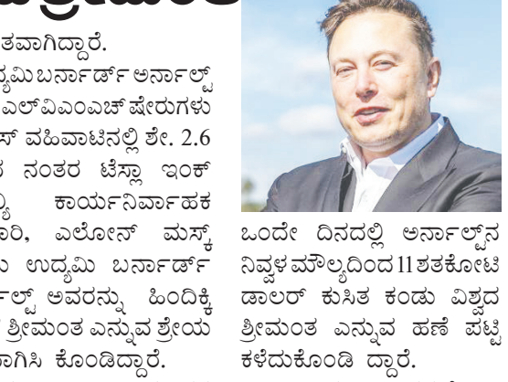
ಬಂದೇ ದಿನದಲ್ಲಿ ಅರ್ನಾಲ್ಡ್ ಅಜರ ಎಲ್‌ಎಂಎಚ್ ಷೇರುಗಳು ಪ್ರಾರಿಸ್ ವಹಿವಾಟಿನಲ್ಲಿ ಶೇ. 2.6 ಕುಸಿದ ನಂತರ ಟೆಸ್ಲಾ ಇಂಕ್ ಮುಖ್ಯ ಕಾರ್ಯನಿರ್ವಾಹಕ ಅಧಿಕಾರಿ, ಎಲೋನ್ ಮಸ್ಕ ಅವರು ಉದ್ಯಮಿ ಬರ್ನಾರ್ಡ್ ಅರ್ನಾಲ್ಡ್ ಅವರನ್ನು ಹಿಂದಿಕ್ಕಿ ವಿಶ್ವದ ಶ್ರೀಮಂತ ಎನ್ನುವ ಶ್ರೇಯ ತನ್ನದಾಗಿಸಿ ಕೊಂಡಿದ್ದಾರೆ.

ವಾಷಿಂಗ್ಟನ್, ಜೂ.1- ವಿಶ್ವದ ಪ್ರಮುಖ ಉದ್ಯಮಿ ಅರ್ನಾಲ್ಡ್ ಅಜರ ಎಲ್‌ಎಂಎಚ್ ಷೇರು ಕುಸಿತ ಕಾರಣದಿಂದ ಉದ್ಯಮಿ ಎಲೋನ್ ಮಸ್ಕ ಮತ್ತೆ ವಿಶ್ವದ ಅತ್ಯಂತ ಶ್ರೀಮಂತ ವ್ಯಕ್ತಿಯಾಗಿ ಬಿಂಬಿತವಾಗಿದ್ದಾರೆ.